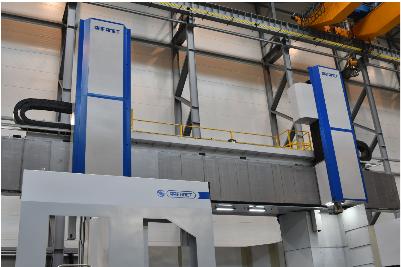
Tokarka karuzelowa KCI 500 N